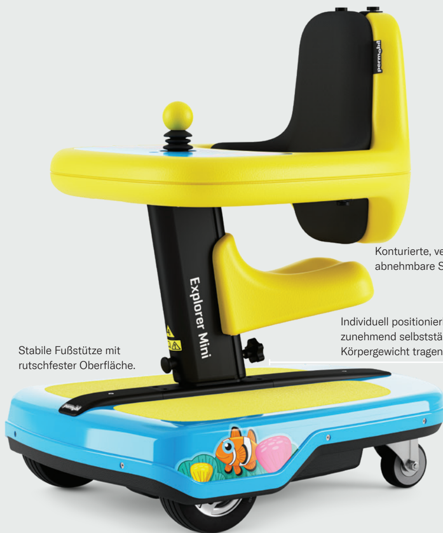
Konturierte, verstellbare, abnehmbare Sitzfläche